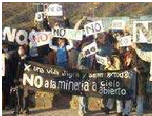
Protestas contra los proyectos de megaminería

El Centro de Bioética de la Universidad Católica de Córdoba expresó su preocupación y necesidad de contribuir al debate que plantea el avance de los proyectos de megaminería y sus consecuencias, como en el caso de La Rioja y Catamarca.