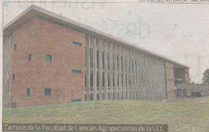
Campus de la Facultad de Ciencias Agropecuarias de la UCC