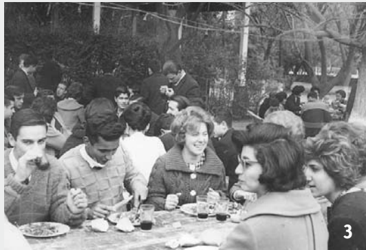
Foto 2 y 3: tardes de picnic en Alta Gracia en 1960 y 1961, respectivamente.

Puedes enviarnos tus fotos, indicando evento, año y nombre de los protagonistas al correo: revista.alumni@uccor.edu.ar .